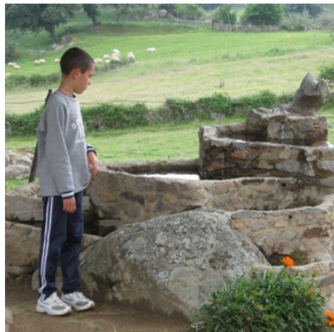
Bambino che osserva una delle fonti durante la visita in Fattoria